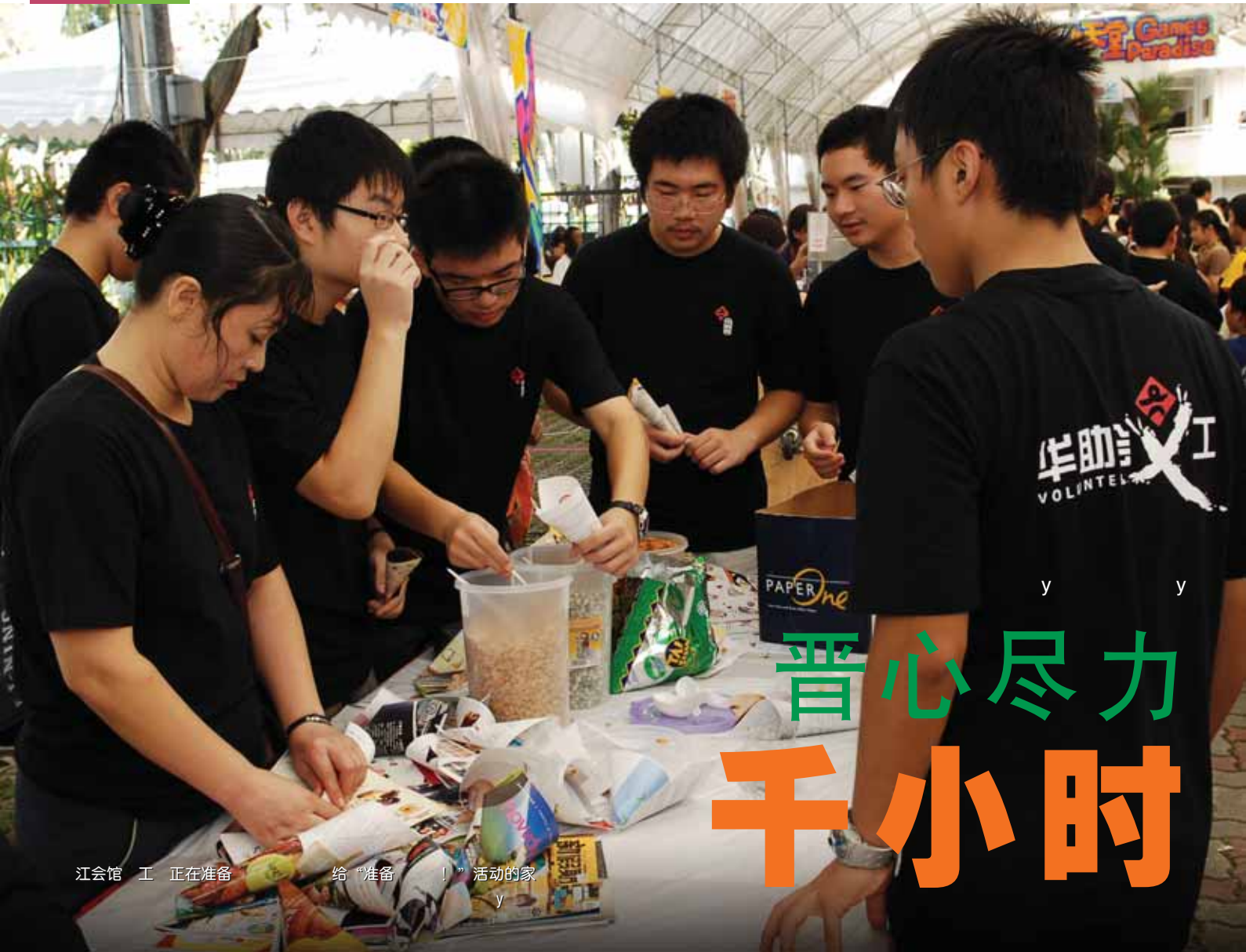
晋江会馆义工正在准备给“准备！”活动的家